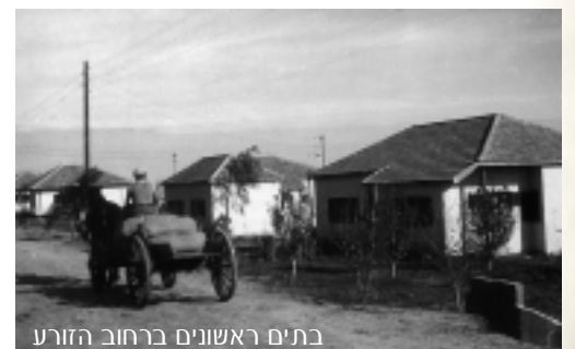
בתים ראשונים ברחוב הזרוע

מדינת ישראל קמה ושורדת מתוך ובתוך מאבק מתמשך: כוח יהודי ולאחריו צה"ל, עמדו מול התנגדות האומה הערבית ומדינותיה לשיבת היהודים לארץ אבותיהם ואל מורשתם ולהקמת מדינת ישראל כבית לאומי לעם היהודי. במאבק זה שילמה החברה בישראל מחיר דמים קשה מנשוא במלחמות, בפעולות איבה, בפעולות צבאיות ומטרור. לצד הישגים לאומיים בתחומי המדע, התרבות, האומנות והתעשייה, אנו מלווים ביגון השכול ובכאב הפצועים עד היום הזה.