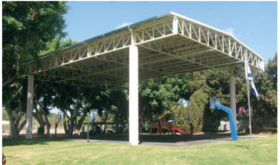
קירי מגרש הספורט בבית הספר, אותו יזמה המועצה ומימנה בסיוע מפעל הפיס.

בינתיים, בעוד שברשות המים והביוב מתקשים להציג פתרון חוקי להקמת מערכת ביוב בכפר שמריהו, תובע המשרד להגנת הסביבה את ראש המועצה על הפרת החוק המחייב הקמת ביוב ובכך, לכאורה, נגרם זיהום סביבתי. אנו נמצאים במאבק מול הרגולטורים, שהוא בעצם מאבק על שמירת עצמאות הכפר.