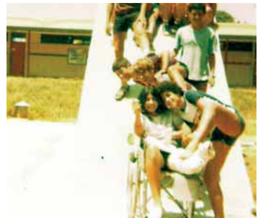
יושבים על המקלט, שנת 1977