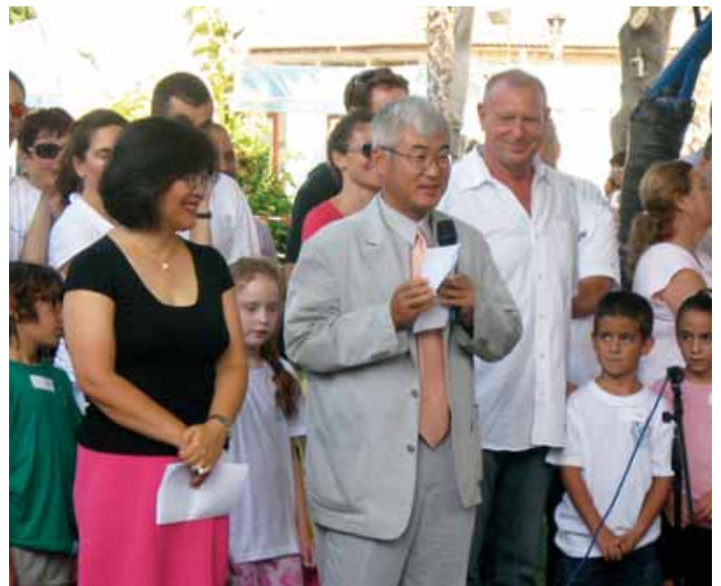
שגריר קוריאה הדרומית, מר מה יאנג-סאם ורעייתו, המתגוררים ברשפון, מברכים את ילדי ביה"ס והוריהם בטקס פתיחת שנת הלימודים.